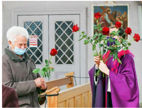
KRANKENSALBUNG IN DER PFARRKIRCHE VOM 9. MÄRZ