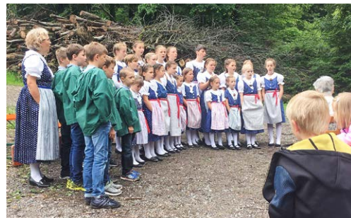
2019 sang das Kinderjodelchörl «chli heimelig» aus Kaltbrunn.

Der christliche Bauernbund freut sich, seine Mitglieder und viele Besucher*innen im Kohlloch zum Gottesdienst begrüßen zu dürfen. Die musikalische Gestaltung ist noch eine Überraschung. Für Schmaus und Trank ist in der «Wald-Gartenwirtschaft» anschliessend gesorgt. Bei Schlechtwetter findet der Gottesdienst in der Kirche in Maseltrangen statt.