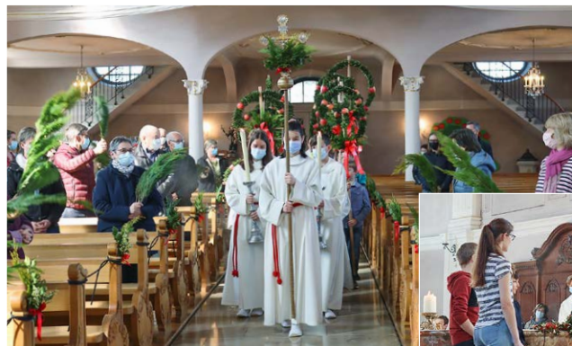
PALMSONNTAG VOM 28. MÄRZ